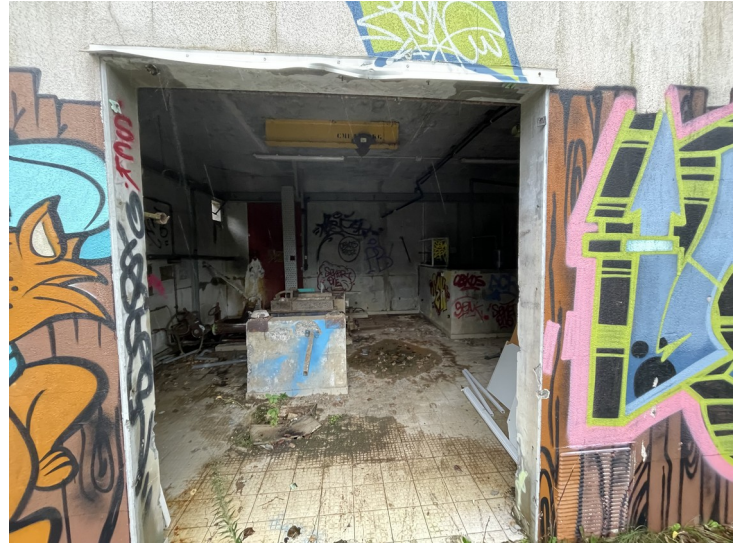
Bassin tampon (à gauche) et local attenant à la station d'épuration (à droite)