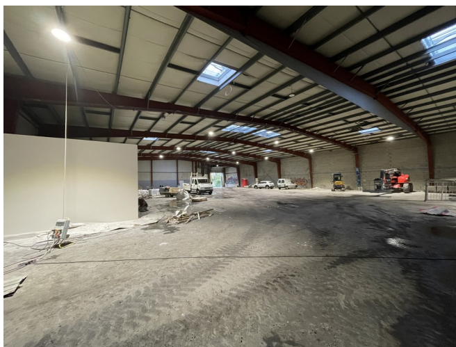
Hangars en cours de réhabilitation